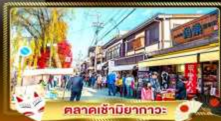
ตลาดซามิยากาวะ