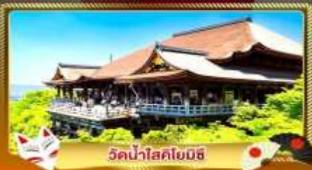
วัดน้ำสอโยมิชิ

ชมงานประดับไฟสุดอลังการ นานาโนะ โนะ ซาโตะ