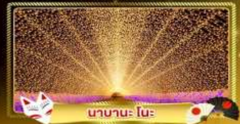
นานาโนะ โนะ