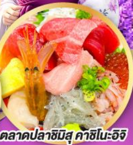
ตลาดปลาชิบิสุ คาชิโนะอิชิ