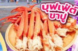
บุฟเฟ่ต์ ภูเขา