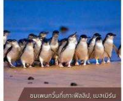
ชมเพนกวินก็เกา-ฟิลลิป, เมลเบิร์น