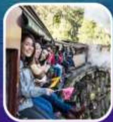
รถไฟจักรไอน้ำโบราณ