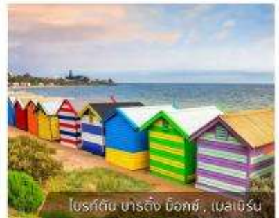
โบสถ์ดิน ชาติถึง ด็อกซ์, เมลเบิร์น