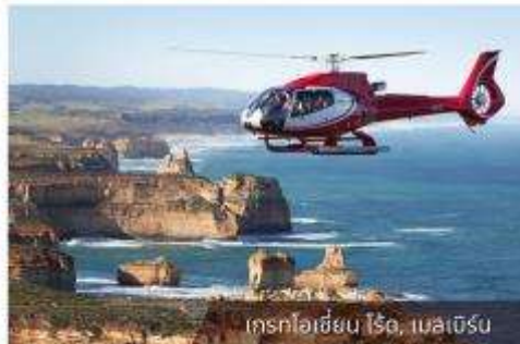
เฮลิคอปเตอร์บิน, เมลเบิร์น