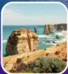
Great Ocean Road (ครึ่งสาย)