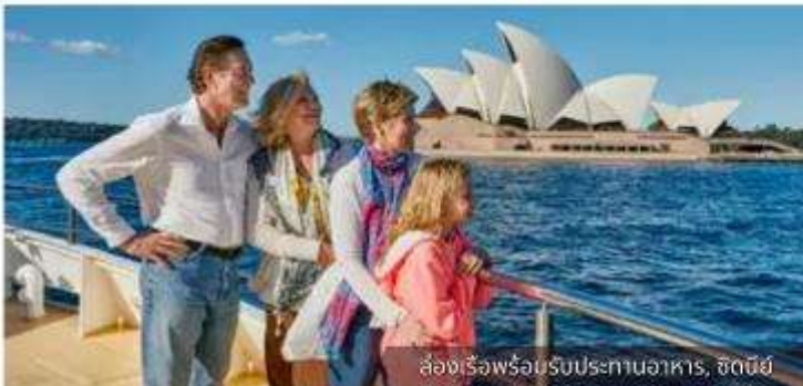
ล่องเรือพร้อมรับประทานอาหาร, ซิดนีย์