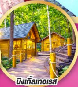
มิงเกิ้ลเกอเรส