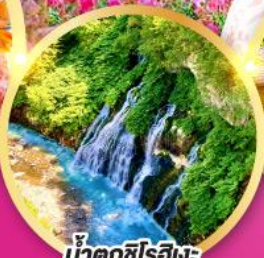
น้ำตกชิโรฮิเมะ