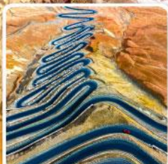
ถนนผานหลงกู่ต้าว