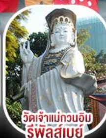
วัดเจ้าแม่กวนอิมรีพัลส์เบย์