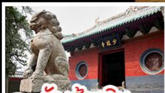
วัดส่าหลิน