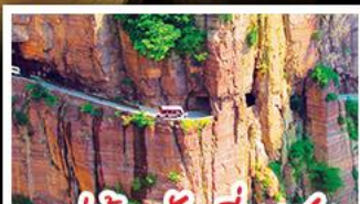
หมู่บ้านกิวเสียงซุน