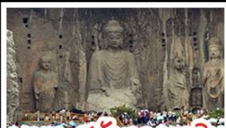
พลาแกะสลักเขลงเจมีน

เที่ยวครบ 4 มรดกโลก กำแพงเมืองจีน - สุสานฉินซีฮ่องเต้ - วัดส่าหลิน หมู่บ้านไต้ดินसानโจว - หมู่บ้านกิวเสียงซุน