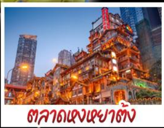
ตลาดแดงเขาดัง