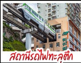
สถานีรถไฟทะเลลึก

ดงซิ่ง - อุโมงค์ - หงหยาดัง - อุทยานเขานางฟ้าดงซิ่ง สถานีรถไฟทะเลลึก - หลุมฟ้าสามสะพานสวรรค์