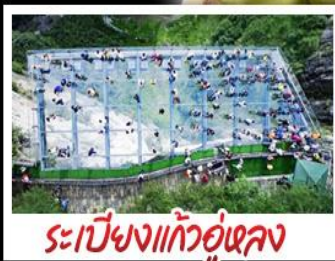
ระเบียงแก้วอุโมงค์