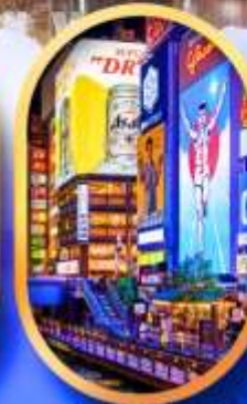
ย่านชิบโฮนาชิ