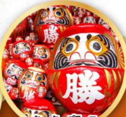
วัดคัตสึโฮจิ (วัดदारุมะ)

ชมความงามของกำแพงหิมะ เส้นทางสายอัลไพน์ทาเคยาม่า (JAPAN ALPS SNOW WALL)