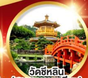
วัดซีหลิน (สวนหนานเทสิยน)