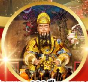
วัดแซก 600 ปีหยุดหลง