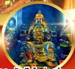
วัดปักไต้ฮ้องอำ