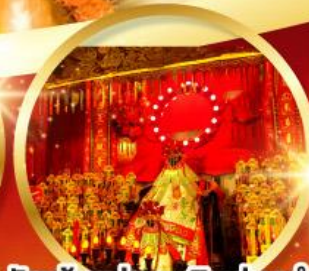
วัดเจ้าแม่กวนอิมฮ้องอำ