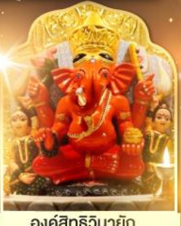
องค์สิทธีวินายก