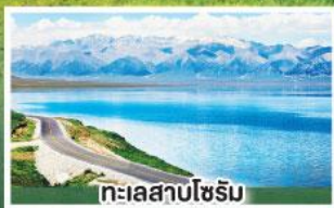
ทะเลสาบไซรัม