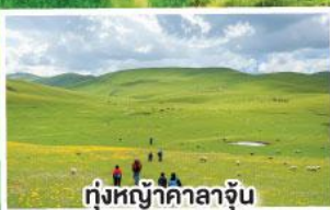
ทุ่งหญ้าคาลาจัน