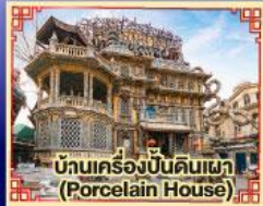
บ้านเครื่องปั้นดินเผา (Porcelain House)