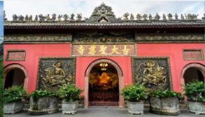
วัดต้าจื่อ