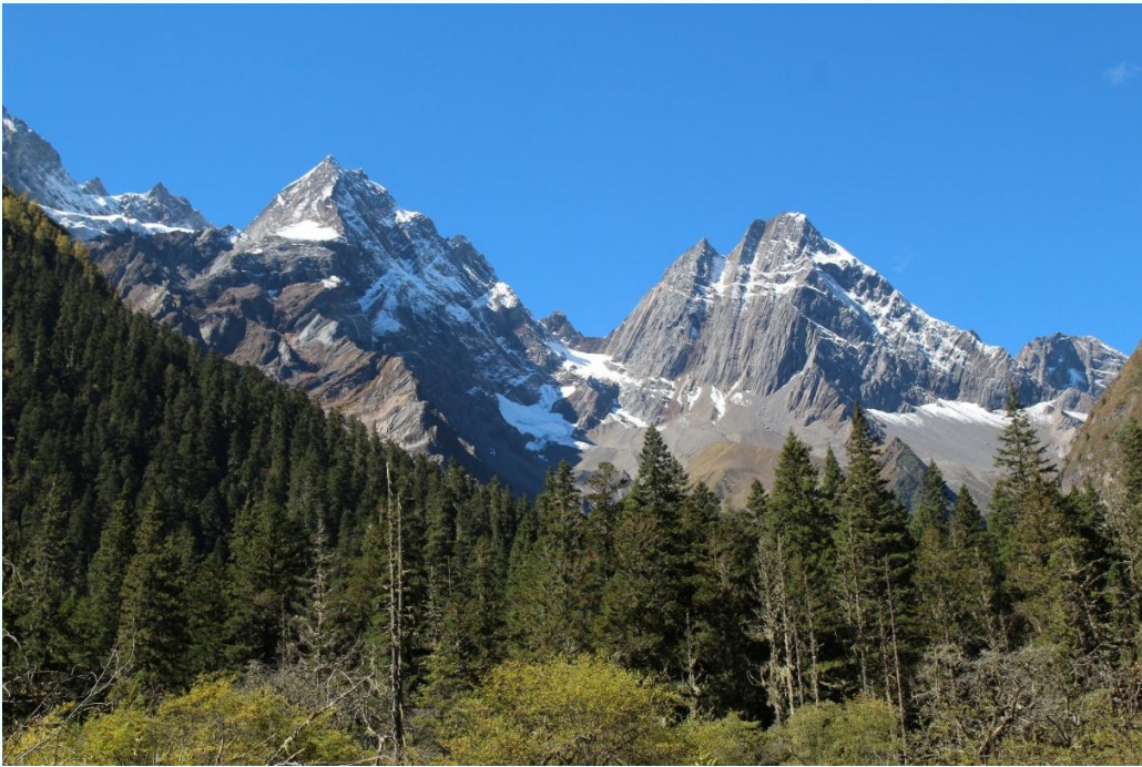
ฤดูใบไม้ผลิ (SPRING)