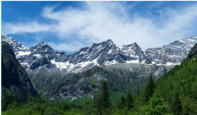
ภูเขาสีดรุณี (หุบเขาชวงเจียวโกว)