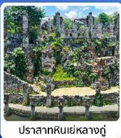
ปราสาทหินเย่หลางกู๋

● ไฮไลท์ น้ำตกหวงกัวซู่ น้ำตกที่ใหญ่ที่สุดของจีน แหล่งท่องเที่ยวระดับ 5A ชมความสวยงาม หมู่บ้านเวียงจ้าย หมู่บ้านจีนโบราณ