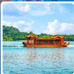
ล่องเรือทะเลสาบหลิวเว่��