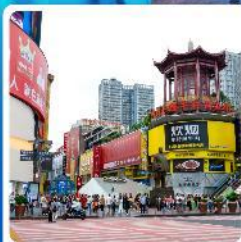
ถนนหวงซิงสู