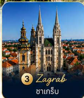
3 Zagreb ซาเกร็บ