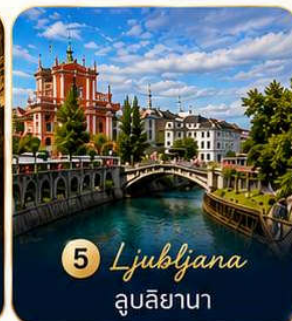
5 Ljubljana ลูบลิยานา