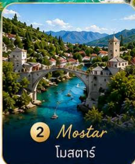
2 Mostar โมสตาร์