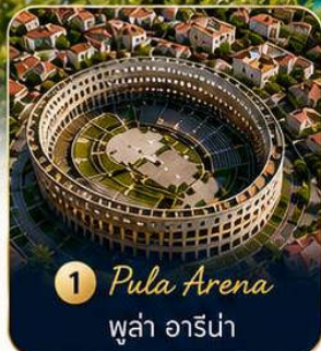
1 Pula Arena พู่ลา อาร์น่า