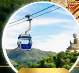
รวมกระเช้าฮ่องกง