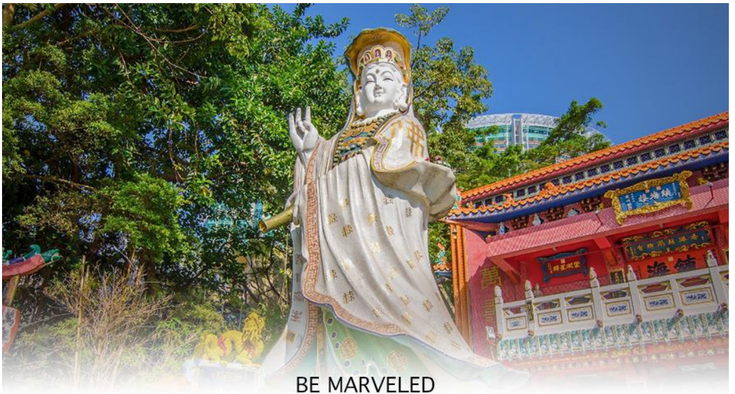
BE MARVELED วัดเจ้าแม่กวนอิมริพัลส์เบย์

การเงิน และขอพรขอ โชคลาภเพื่อเป็นสิริมงคลและขอพร เจ้าแม่ทับทิม หรือ เทพธิดาแห่งท้องทะเล ซึ่งทำหน้าที่ปกป้องกันคุ้มครองชาวประมง ตั้งโดดเด่นอยู่ท่ามกลางสวนสวยที่ทอดยาวลงสู่ชายหาดให้ท่านนมัสการขอ และนำท่านเดินข้าม สะพานต่ออายุ ซึ่งเชื่อกันว่าข้ามหนึ่งครั้งจะมีอายุเพิ่มขึ้น 3 ถ้าข้ามแล้วห้ามเดินย้อนกลับไปเด็ดขาด เพราะคนฮ่องกงเชื่อว่าชีวิตจะสั้นลงไป 3 ปี สำหรับคนโตจะนิยมขอพรกับ เทพเจ้าแห่งความรัก ให้เอามือลูบที่บริเวณหินสีดำ พร้อมกับอธิษฐานให้สมหวังกับความรัก ปิดท้ายด้วยการรับพลังดวงจี้จาก ศาลา แผลทิส ซึ่งถือเป็นจุดรวมรับพลัง ถือเป็นจุดที่มีดวงจี้ดีที่สุดของเกาะฮ่องกง และยังมีรูปปั้นองค์เทพอีกมากมายภายในวัดแห่งนี้ ให้กราบไหว้ขอพร