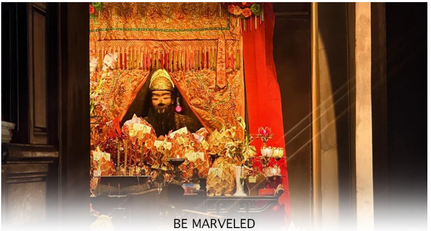
BE MARVELED วัดแซกง อนุรักษ์ 600 ปี

ถึง 600 ปี แล้วยังเป็นเพราะเป็นวัดแซกงดั้งเดิม เป็นวัดแซกงแห่งแรกที่สร้างขึ้นเพื่อบูชาเทพเจ้าแซกง ซึ่งคือแม่ทัพแซกงวีรบุรุษผู้กล้าหาญและซื่อสัตย์จากสมัยราชวงศ์ซ่งใต้ (ค.ศ. 1127-1279) ซึ่งได้รับการยกย่องจากฮ่องเต้จากวีรกรรมในการปราบกบฏทางตอนใต้ของจีน สาเหตุที่วัดแซกงถูกสร้างขึ้นที่นี่ เพราะมีตำนานเล่าว่า ท่านแม่ทัพแซกงได้ให้การคุ้มครองจักรพรรดิเจ้าปิง องค์จักรพรรดิองค์สุดท้ายของราชวงศ์ซ่งใต้ ระหว่างการเสด็จหนีลงใต้มาตั้งหลักแหล่งที่นี่ก่อนราชวงศ์จะล่มสลาย ด้วยความซื่อสัตย์และความกล้าหาญเป็นที่ประจักษ์ ชาวบ้านจึงเริ่มบูชาแม่ทัพแซกงหลังจากท่านเสียชีวิตลง