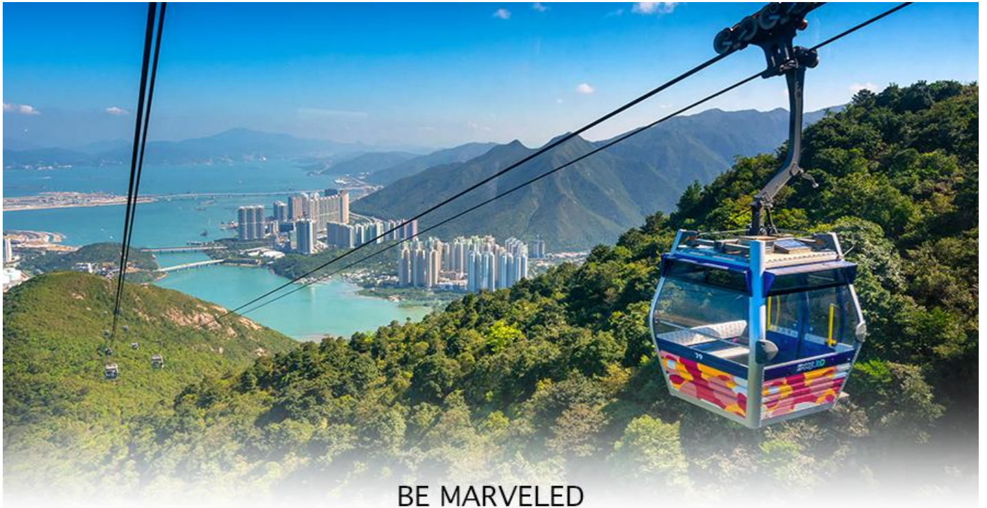
BE MARVELED กระเช้ามองปีง

ของอุทยานบนเกาะลันเตาเหนือ ถือได้ว่าเป็นแหล่งท่องเที่ยวอันมีเอกลักษณ์ระดับโลกของฮ่องกง (**กรณี กระเช้ามองปีง 360 มีการปิดซ่อมบำรุง หรือ มีการปิดเนื่องจากสภาพอากาศแปรปรวน ทางบริษัทฯ ขอสงวน สิทธิ์ในการเปลี่ยนเป็นใช้รถโค้ชของทางอุทยานในการเดินทาง เพื่อนำท่านขึ้นสู่หมู่บ้านวัฒนธรรมมองปีง บน เกาะลันเตาแทน**) จากนั้นนำท่านไปสักการะ (พระใหญ่เกาะลันเตา หรือ พระพุทธรูปเทียนถาน (TIAN TAN BUDDHA STATUE))