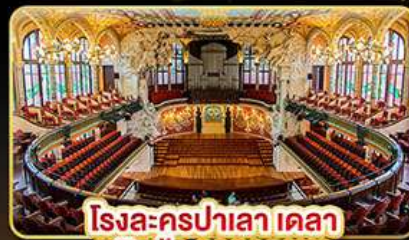
โรงละครปาเลา เดลา มุสิก้า คาคาลานา