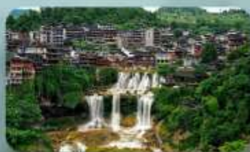
หมู่บ้านฟุทงเจิ้น