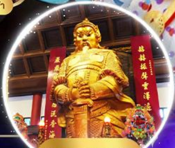
วัดแซงหมิว