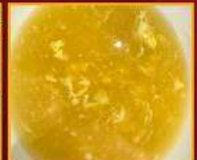
ซุปรข้าวโพด