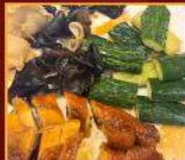
ไก่ แดงกวาง เห็ดหูหนู