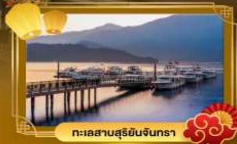
ทะเลสาบสุริยจันทร์