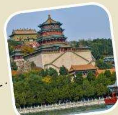
4 พระราชวังฤดูร้อน