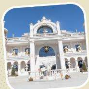
6 POP LAND