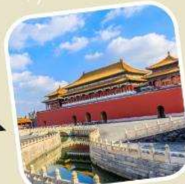
3 พระราชวังต้องห้าม