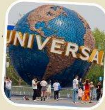
5 UNIVERSAL BEIJING