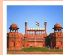
♥♥♥ Agra Fort