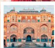
♥♥♥ Amber Fort