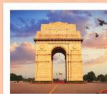
♥♥♥ India Gate