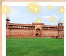
Ajmer Sharif Dargah