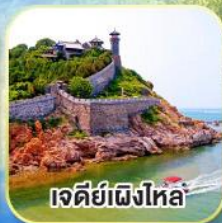
เจดีย์เฝิงไหล