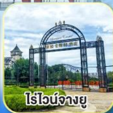
ไร่วินิจฉัยยู